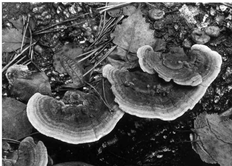
Zonen – Porling ( Trametes zonata)